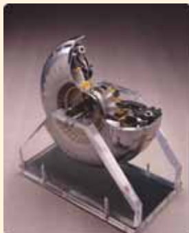
トルクコンバータ