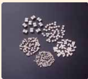
積層セラミックコンデンサ