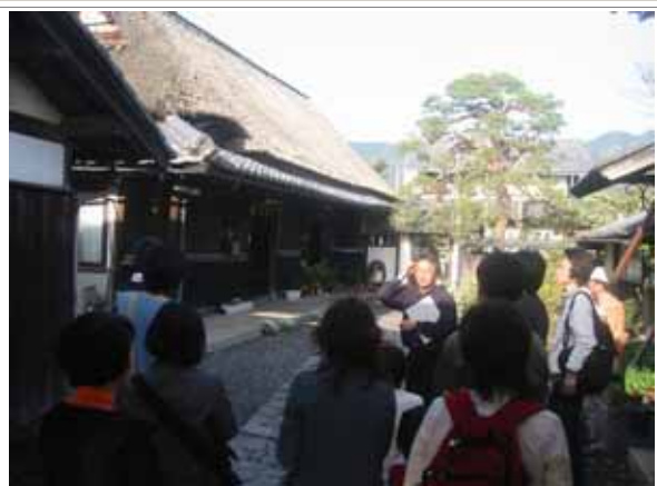
都市住民の古民家再生見学会