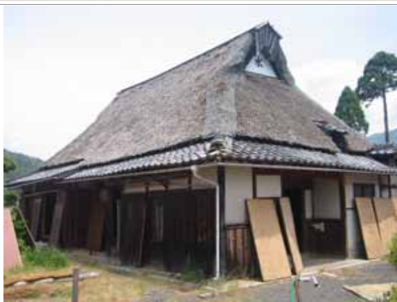
湖北特有の伊香造り古民家