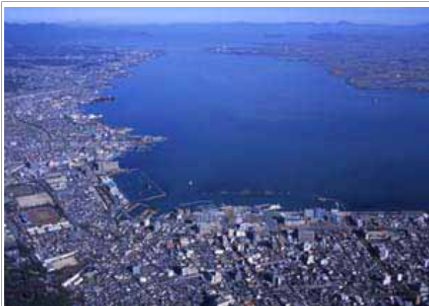
大津港と琵琶湖南部