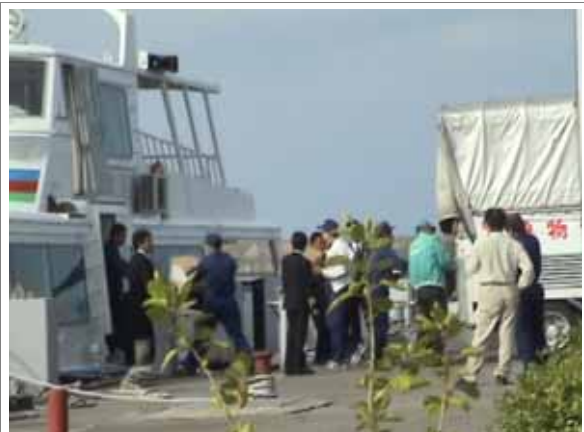
緊急物資等の湖上輸送