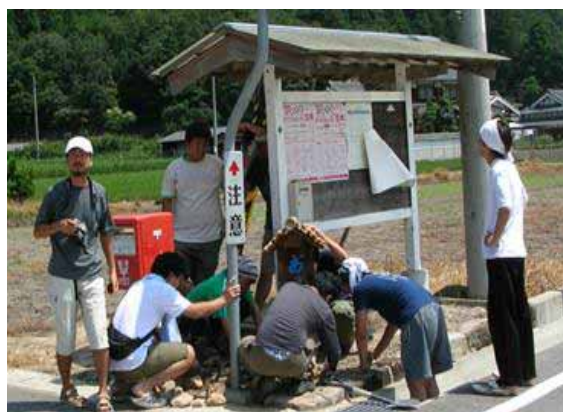
大学生の地域研究活動