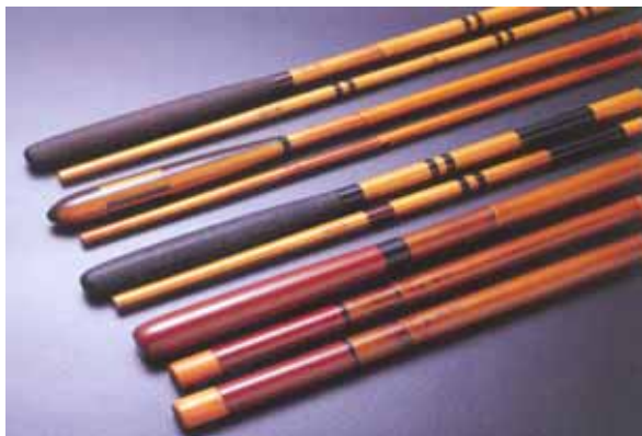
和歌山県伝統工芸品 「紀州へら竿」