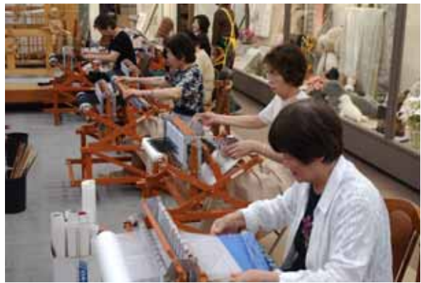
地場産品の「再織」を体験する市民