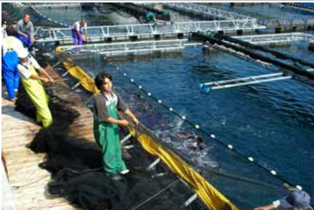
養殖鯛の出荷風景