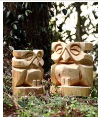
木質廃棄物を利用した 木工芸品の一例