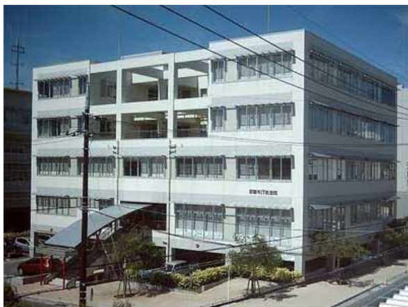
ITインキュベート施設「那覇市IT創造館」