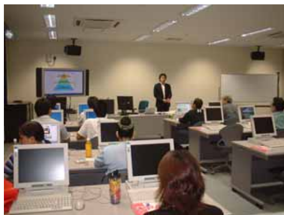
モバイルサポート人材育成研修風景