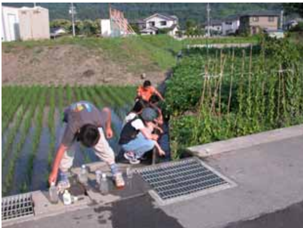
清流と親しむ子どもたち