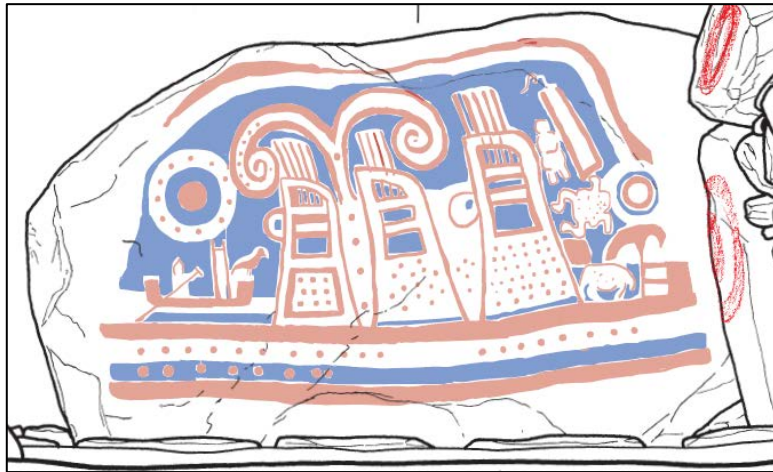
珍敷塚古墳に描かれた壁画