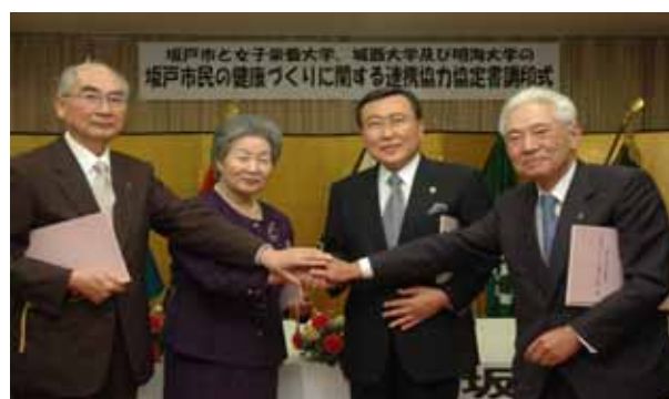
市と市内3大学との市民健康づくり連携協定調印式から