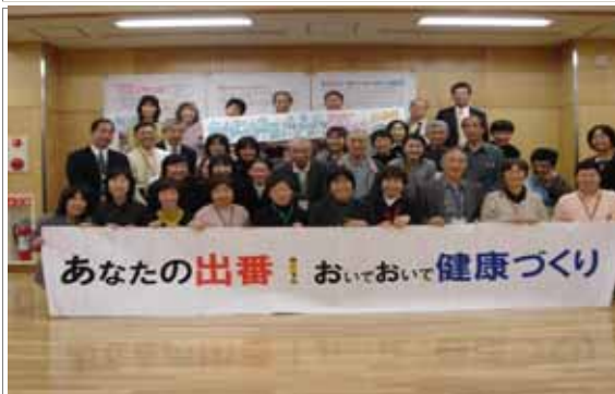
市民健康づくりサポーター「元気にし隊」の活動から