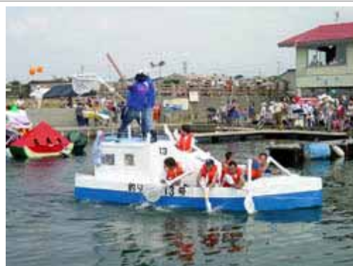
石田漁港イベント