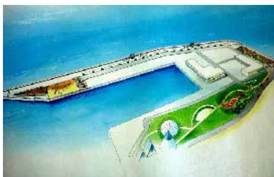
魚津港完成イメージ図