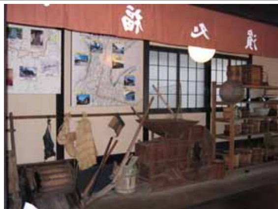
中山道の宿場町に残る民具類