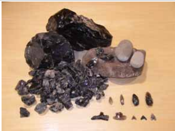
豊富な黒耀石の原石と石器