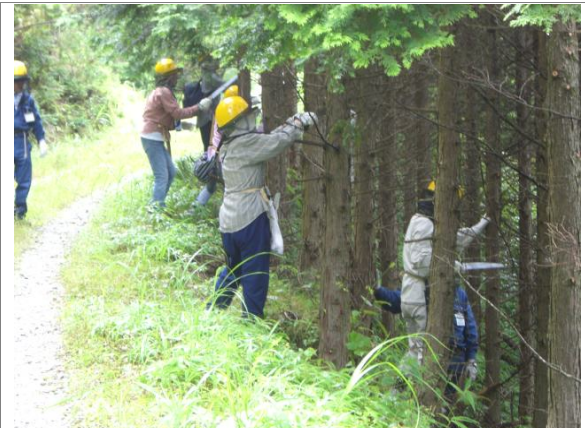
都市住民による枝打ち体験