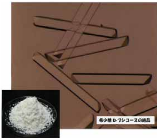
希少糖とその結晶