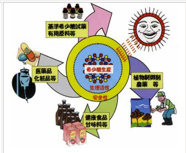
希少糖研究の到達点