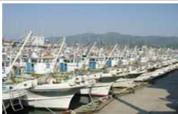
輪島港（拠点市場を目指す）