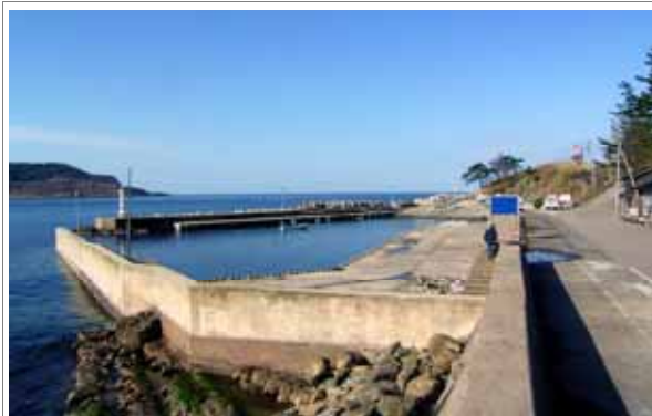
皆月漁港（地域活性化を目指す）