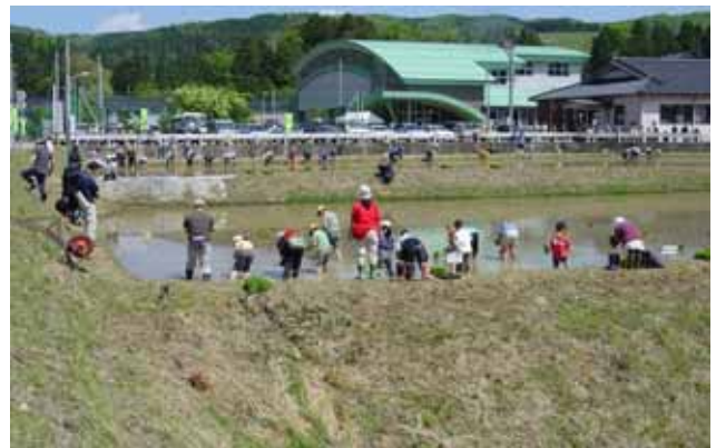
全国ブランド「神子原米」の田植え体験