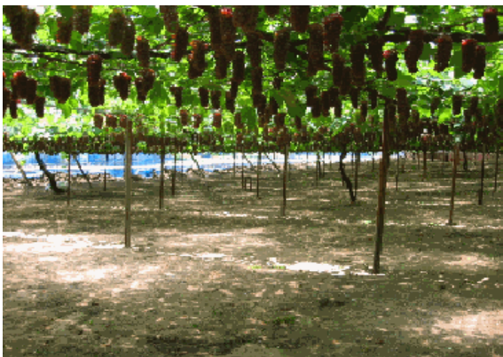
宝達志水町地内の砂丘地で栽培が盛んなブドウ(デラウエア)