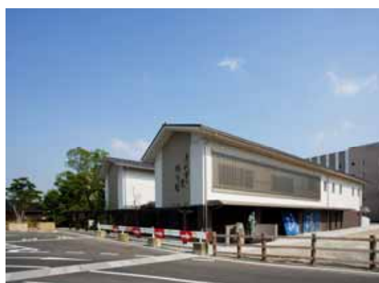
にぎわい創出の拠点・千代女の里俳句会館