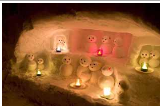
白山麓地域を代表するイベント・雪だるままつり