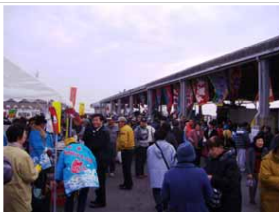
白塚おさかなまつり