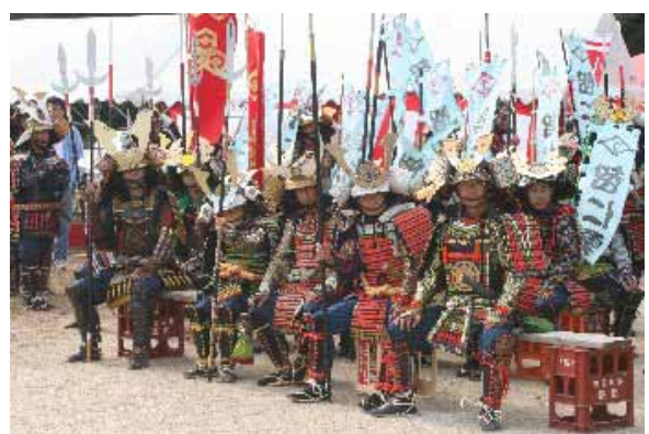
小谷城ふるさと祭り