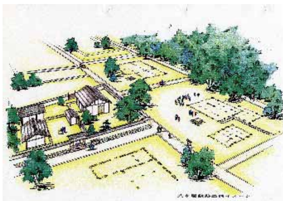
小谷城野外博物館構想図