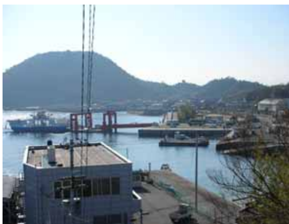
泊漁港フェリー乗降状況