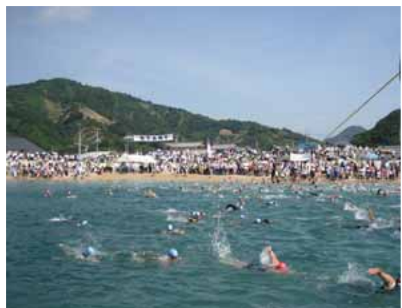
第 21 回トライアスロン中島大会