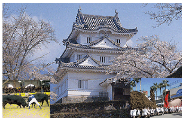
闘牛、宇和島城、牛鬼まつり