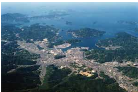
宇和島市と宇和海