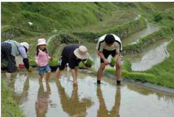
泉谷棚田において田植え体験