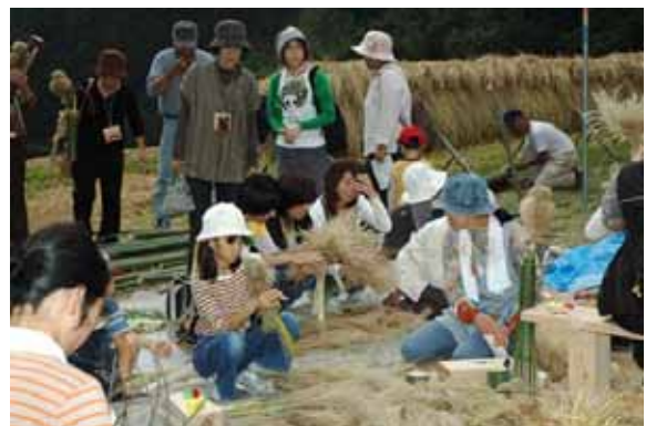
わら・竹細工づくり(石畳むら並み博物館)