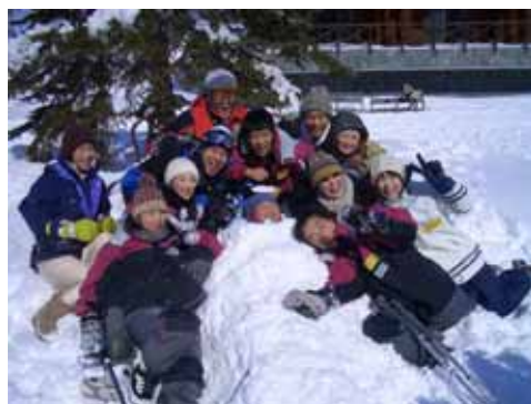
特色あるアクティビティを提供