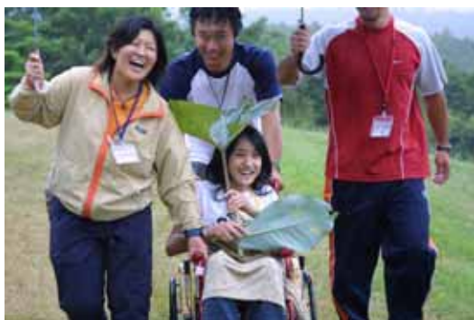
大きな蔭を傘がわりに