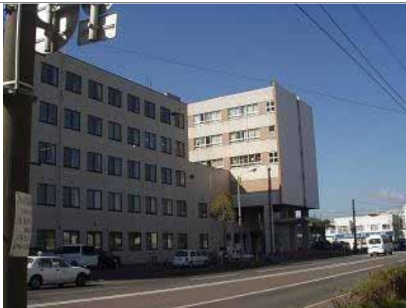
旧苫小牧市立総合病院施設