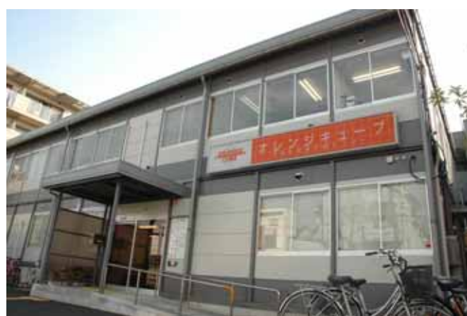
インキュベーション施設「オレンジキューブ」