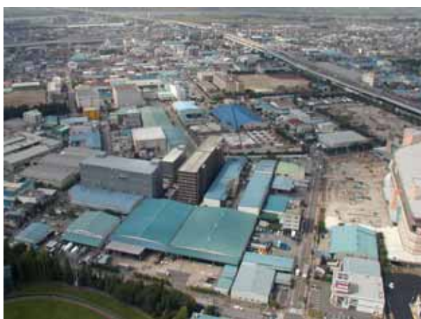
上空から戸田市を臨む

・ 公有地の拡大の推進に関する法律による先買いに係る土地を供することができる用途の範囲の拡大