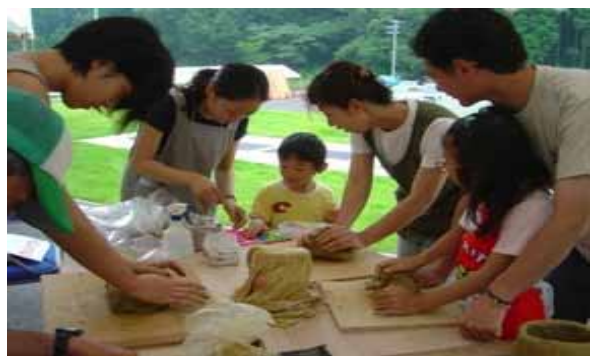
「ジュニア陶芸教室」風景