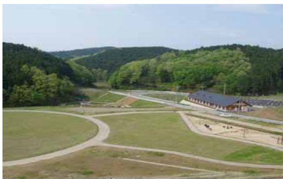
青山ハーモニー・フォレスト