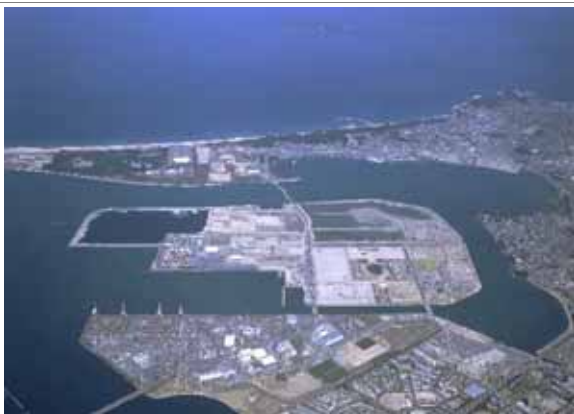
アイランドシティ付近