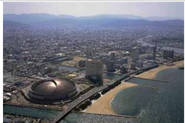
シーサイドももち付近