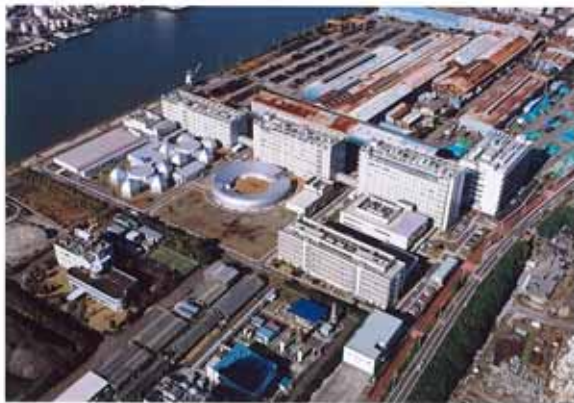
理化学研究所横浜研究所 横浜市立大学鶴見キャンパス