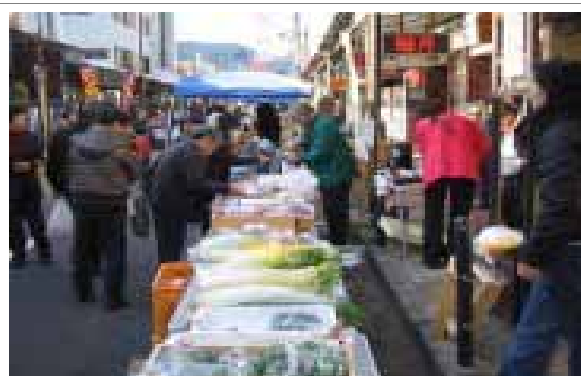
商店街での特産品販売