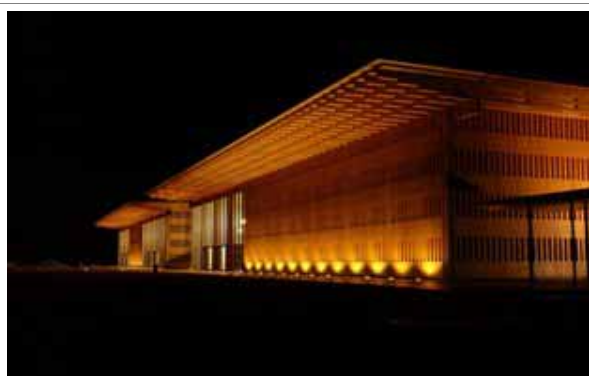
熊野古道センター