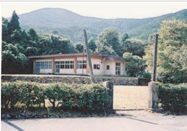
うとじゆく 本山小学校雨通宿分校