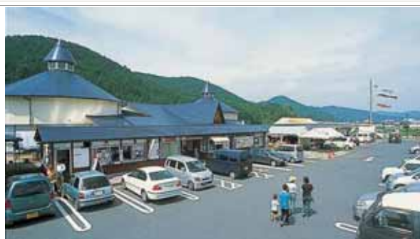
産直販売施設「どんぶり館」