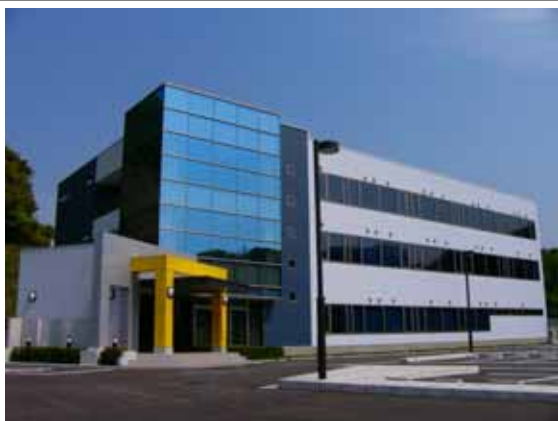
e-ZUKA トライバレーセンター