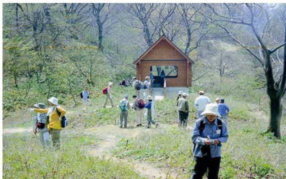
自然環境を活用した、学習フィールド 及び森林レクリエーション