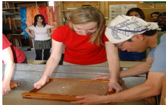
小国和紙体験プログラム へんなかツーリズムの展開