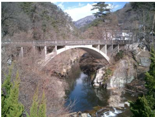
昇仙峡長潭（ながとろ）橋（甲斐市北部）