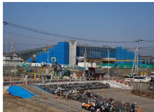
JR 竜王駅と周辺（建設中）