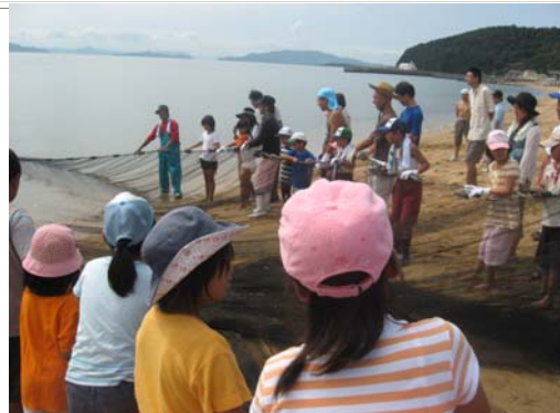
西脇漁港の地引網体験