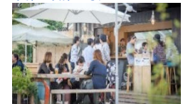
オープンスペースの活用