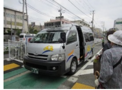
コミュニティバスの導入等