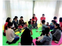
若者世代の入居と多世代交流の促進