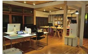
住宅をシェアオフィス等として活用