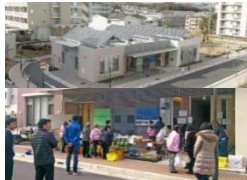
高齢者施設や店舗の誘致

○居住者の高齢化等により多様な世代の暮らしの場として課題が生じている住宅団地について、生活利便施設や就業の場等の多様な機能を導入することで、老若男女が安心して住み、働き、交流できる場として再生