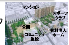
岡山市: 出石小学校跡地整備事業

○廃校跡地等、低未利用の公的不動産の有効活用等について、民間の資金・ノウハウを活用するPPP/PFIの導入を促進