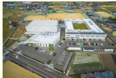
町立中学校の改築に際し、町民体育館と町立図書館の機能を合わせた複合施設を整備する事業（香川県まんのう町） 【利子補給金総額：15,784千円】

地域の課題解決に資する公共施設の整備・再編等においてPFI事業（※1）を活用する際、SPC等の事業者（※2）が金融機関から融資を受ける場合に、利子補給金を支給します。