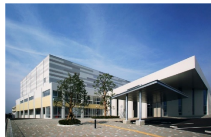
スポーツセンター 町立図書館