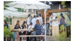
オープンスペースの活用