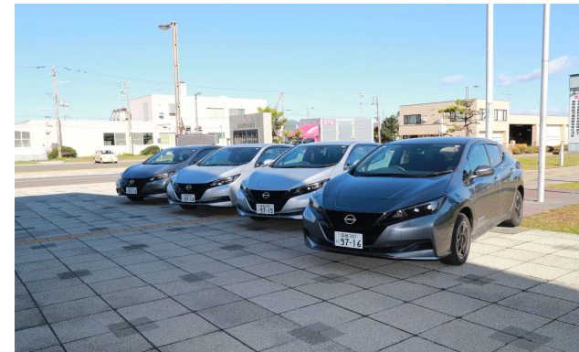
町公用車として導入したEV

※上記のほか、長万部町にキャンパスがある「 東京理科大学と連携したまちづくり事業 」も展開し、大学生と共に地域の賑わいづくりにご支援いただける企業様も募集しております！