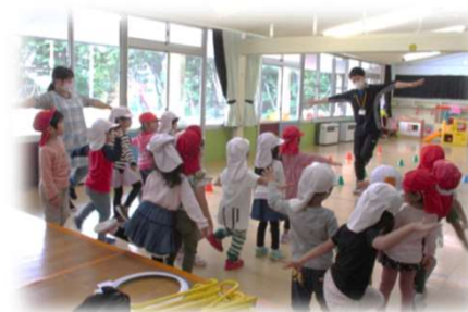
幼児期からの運動習慣形成