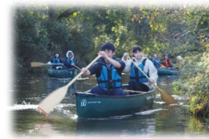
ポー川でのカヌー体験