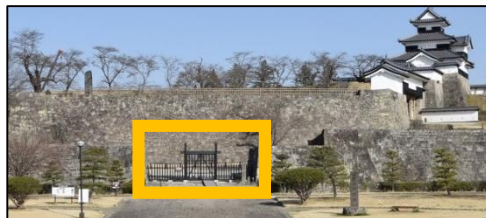
▲清水門がかつてあったところ(黄色枠内)