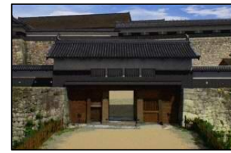
▲CGによる清水門復元イメージ