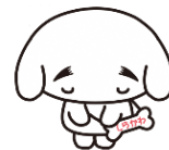
白河市公式ご当地キャラ「しらかわん」

清水門とともに、長く歴史に名を残すことができる 当事業に、ぜひご支援とご協力をお願いいたします。