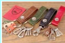
【栃木レザーキーリング作り体験】