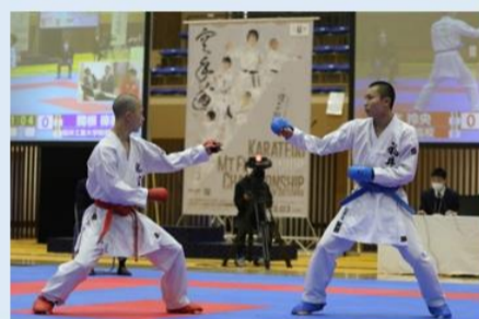
空手道 Mt.Fuji Junior Championship in Gotemba開催

自転車や空手などのオリンピックやパラリンピアンとの交流のほか、ポッチャなどの誰もが参加できるパラスポーツを体験する機会を創出していきます。