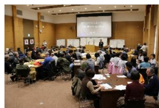
まちづくりシンポジウム