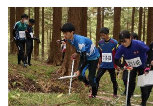
アウトドアスポーツイベント開催