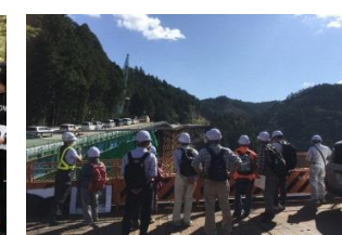
設楽ダム工事見学ツアー