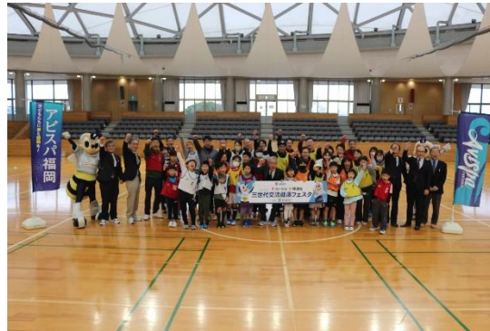
○地元プロスポーツチームとの連携した取組