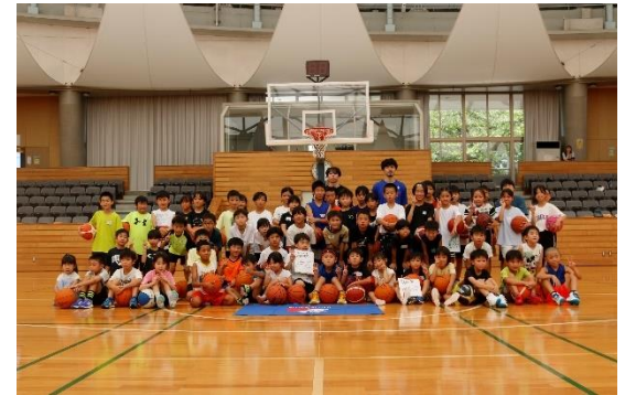
○地元プロスポーツチームとの連携した取組