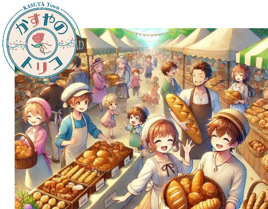
○かすや『パンマルシェ』の開催

そこで、町の認知の獲得とイメージアップを図り、本町を取り巻く様々なステークホルダーにアピールすることを目的として、将来の市制施行に向けたシティプロモーション事業に取り組みます。