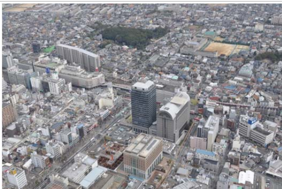
堺東行政ゾーン周辺の堺の都心地域