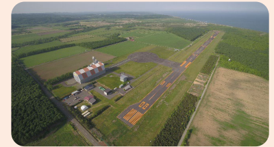
ロケット発射場や滑走路の整備など 航空宇宙産業の推進（北海道大樹町）