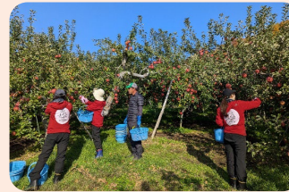
援農ボランティアツアーの実施 (青森県弘前市)